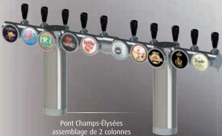
Pont Champs-Élysées assemblage de 2 colonnes